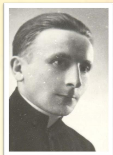
真福若瑟高華斯基

高華斯基十一歲時，衣袋放著本堂神父證明他品格良好的信件，跪在童貞聖母面前祈禱，惦念已分別的母親。五年後，他再到進教之佑堂，但衣袋放著加入慈幼會的申請信。初學期結束後，他宣發神貧、貞潔和服從聖願。在發願時，他在靈修日記寫道：「耶穌，請賜我堅強恆毅的意志。我願意成為聖人。沒有你，我便一無所能。因你的愛，我能成就一切。」數年後，他在實習期快結束時，經歷嚴重的靈性危機，使他幾乎放棄聖召，幸好有位出色的神師助他跨過危機。