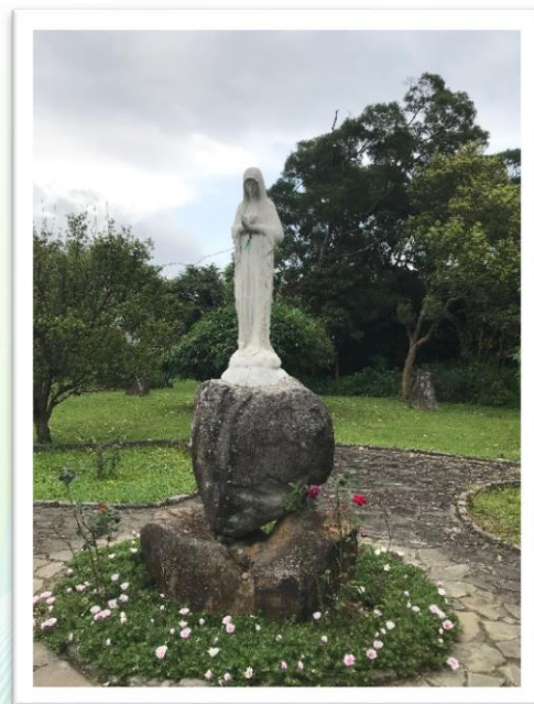
淡水聖本篤修院一景

此外，在這次避靜過程中，發生了一件令我不可思議的事情，在我進行個人的苦路敬禮時，默觀耶穌基督的受難過程，就在我走到最後一處時，腦海中蹦出一句：「願照祢的話成就於我吧！」沒想到，翻到苦路禮儀本最後一頁，結束禱言最後一句也是這句，當時我真的驚呆了！因為以前的我真的只靠個人力量，往往都是遍體鱗傷，個性上是很硬的人，經過多次我降服了！因為我知道我鬥不過祂，雖然知道往後的日子會有痛苦難處，但內心是有祂的，祂會陪我走完。耶穌說「背起十字架，跟隨我吧！」，願我能把握此時此刻，不要為了明天的事情擔憂，今天的苦夠今天受了，一切自有主的安排。