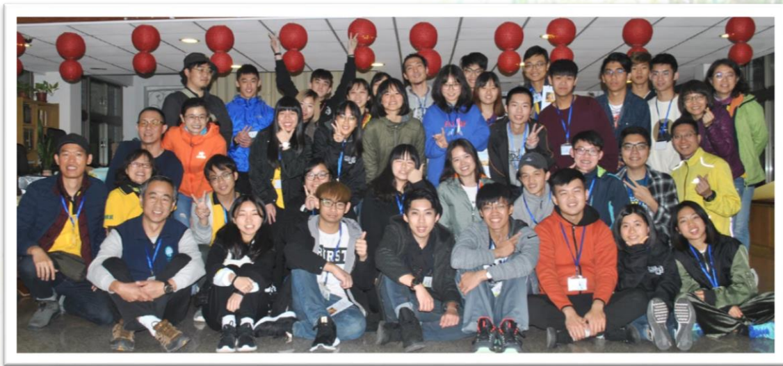
心靈成長營師生合影

第34屆心靈成長營108年3月23-24日於宜蘭礁溪聖母山莊舉辦，以「認識情緒」為主軸，課程內容有：找到好朋友、與情緒共舞、情緒好好玩、星夜夜談、靜謐時刻、真理之巔等；活動第二天至宜蘭礁溪聖母山莊步道。共有40人參加，營隊後陸續舉辦回娘家活動、慶生會、尋蛋活動、端午聚會等，以下為學員心得摘錄：