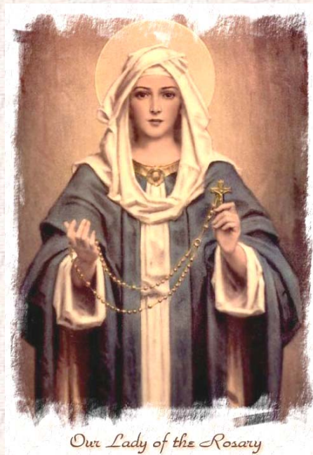
Our Lady of the Rosary

因此，聖母代表的是「基督的母親」，透過聖母的代禱，能夠傳達作子女的祈求，所以，玫瑰聖母月的意義，就是讓我們透過向聖母的祈禱，跟隨聖母的德行，讓我們明白信從基督的重要。